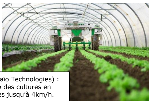
Dino (Naïo Technologies) : binage des cultures en planches jusqu'à 4km/h.