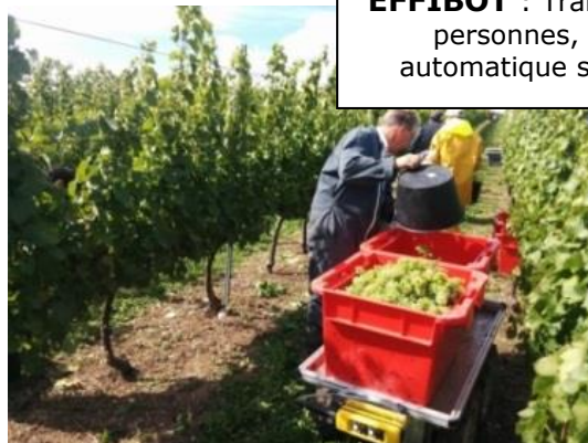
EFFIBOT : Transport, suivi de personnes, le pilotage automatique sur parcelle...