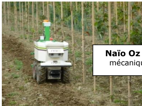
Naïo Oz : désherbage mécanique, transport