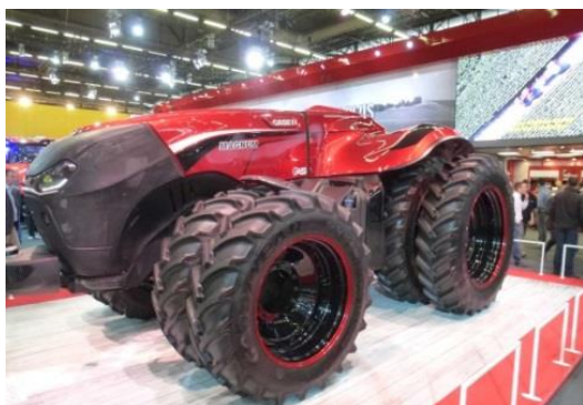
CASE IH et NewHolland : tracteur autonome.