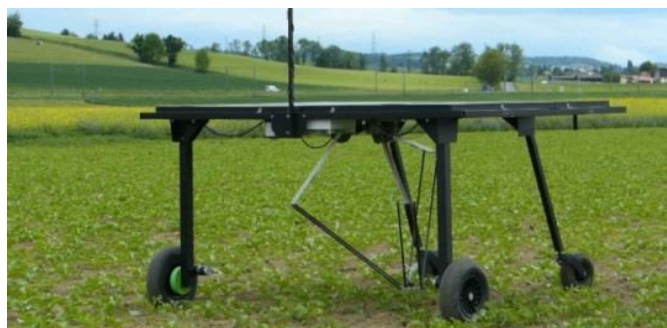
EcoRobotix : désherbage (betteraves, colza, prairies).