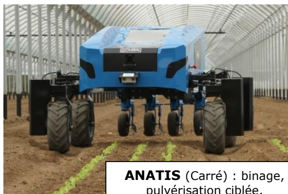
ANATIS (Carré) : binage, pulvérisation ciblée, cartographie de la planche