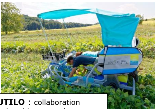
TOUTILO : collaboration homme/machine pour planter, désherber et récolter.